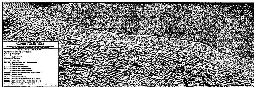
Figura 2. Zonificación de playa Spratt Bight, Resolución 061 de 2019.

A partir de criterios técnicos, entre los que se consideraron aspectos de calidad ambiental, turística y de infraestructura de servicios, entre otros, la Resolución 061 de 2019, presenta la zonificación de la playa de Spratt Bigth, como se observa en el siguiente mapa (Fig.2).