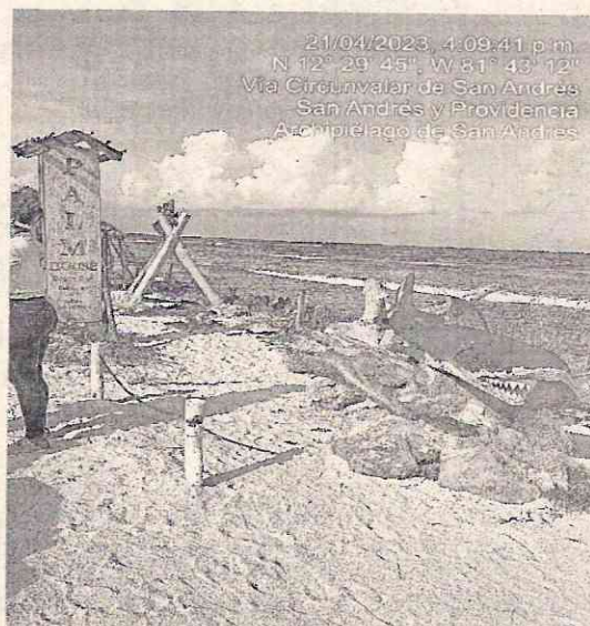
Autor: Fuente Propia (Imagen